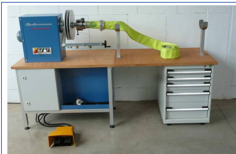
SEM-E 455 WB

De noodstopvoorziening en slipkoppeling voldoen aan de vereisten van UVV.