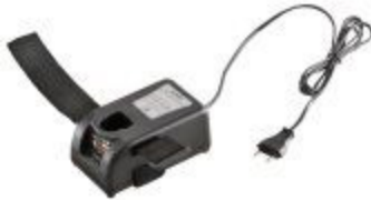
Acculader 12/24 V of 230 V