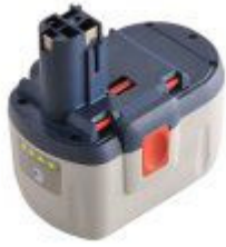
Accu 25,2 V – 2,6 Ah of 5 Ah