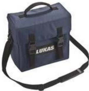
Draagtas voor accu's