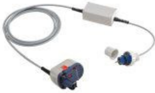
Netadapter 230 V