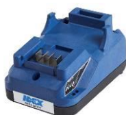
Acculader 12/24 V of 230 V