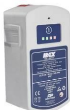
Accu 25,2 V – 5 Ah of 9 Ah IP 68