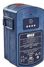
Accu 25,2 V – 9 Ah geschikt voor zoutwater (alleen e3) IP 68