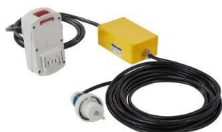
Netadapter 230 V